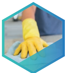
ENTREPRISES DE PROPRIÉTÉ