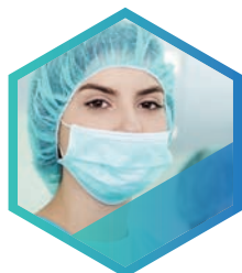
PROFESSIONNELS DE SANTÉ