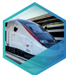
INDUSTRIES & TRANSPORT